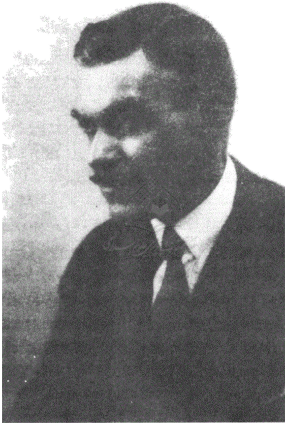
المؤلف لوثر روب ستودارد